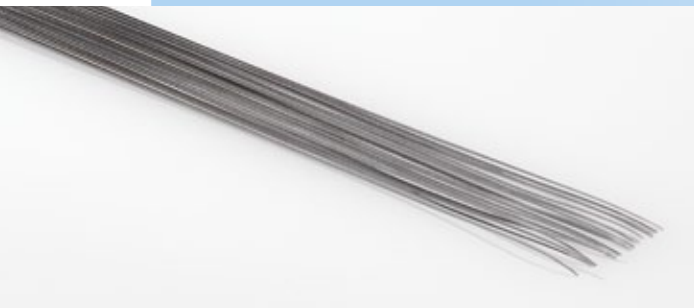
Ø - tw - x - l / Hypotube mit Skive