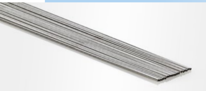
Ø - tw - x - l / Hypotube (lasergeschnitten)