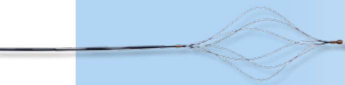
NiTi 4 (6) - DØ - KØ - Form